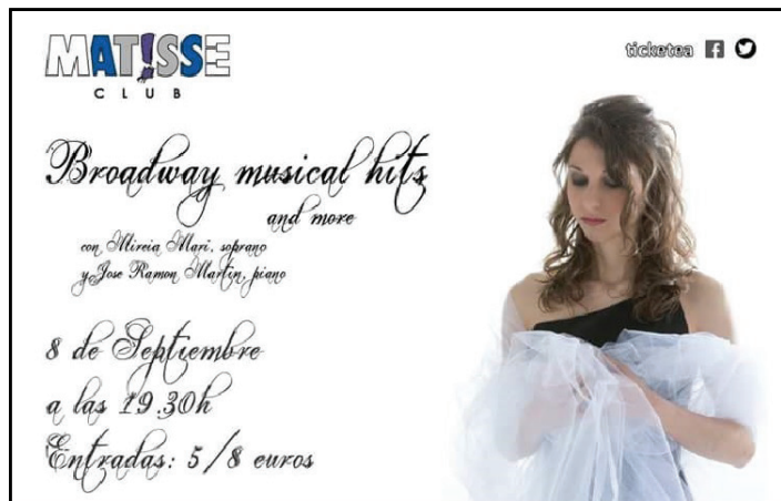
Recital en la Sala Matisse Valencia. 2018.