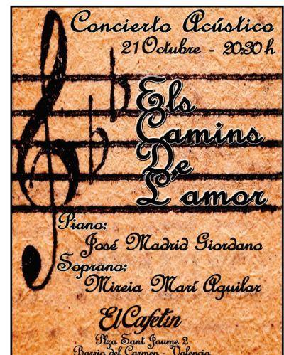
Recital líric en la plaza Sant Jaume de Valencia. Octubre 2017