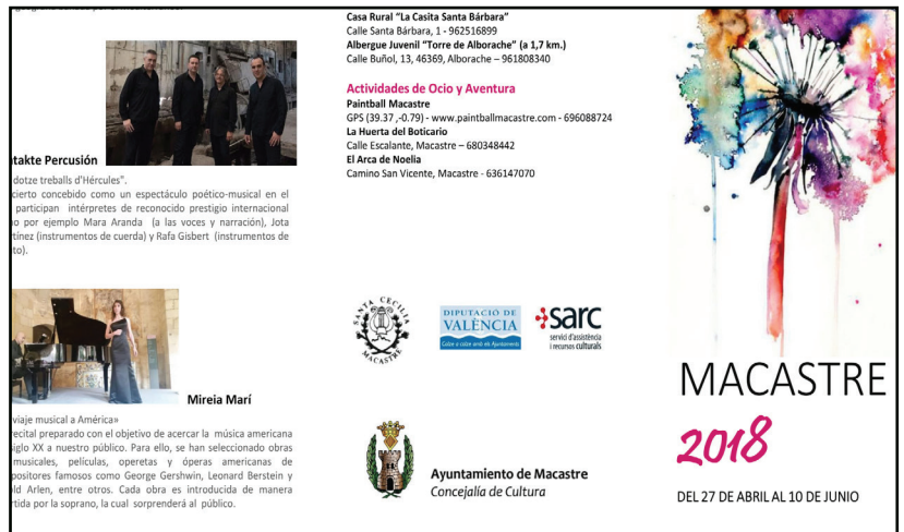
Recital en la Casa de Cultura de Macastre 2018.