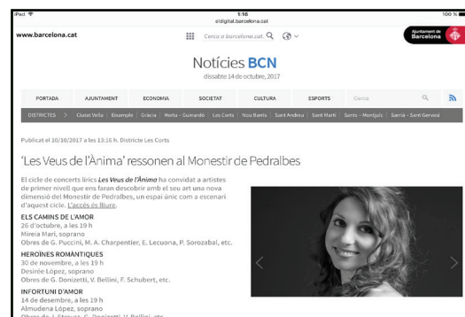
Recital líric en el Monestir de Pedralbes. Octubre 2017.