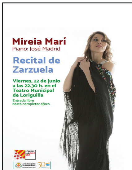
Recital de Zarzuela en el Teatro Municipal. Loriguilla 2018.