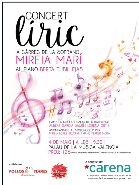
Recital lírico en el Palau de la Música. Mayo 2017.