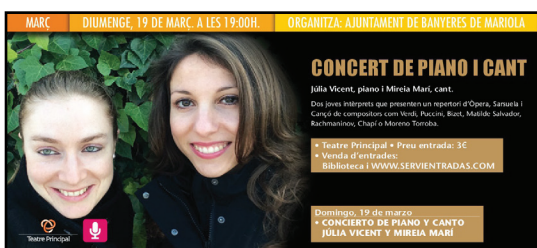
Recital líric en el Auditorio de Banyeres de Mariola. Mayo 2017.