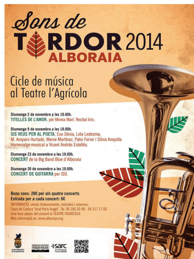
Recital líric en el Teatre l'Agrícola de Alboraia. Novembre 2014.