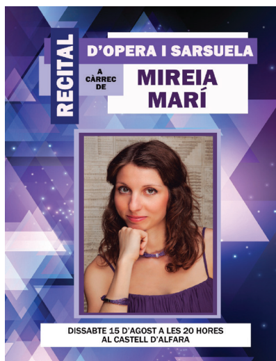
Recital líric en el Palau de la Senyoria de Alfara del Patriarca. Agosto 2016.