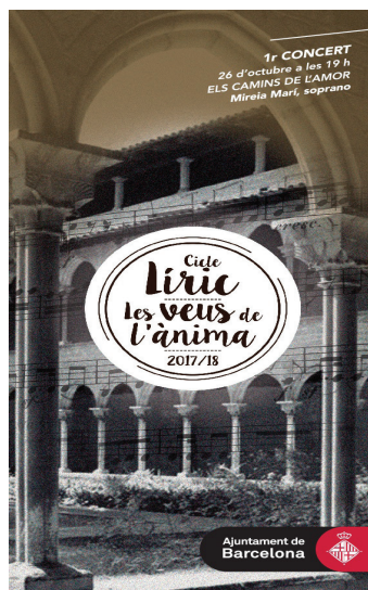
Recital líric en el Monestir de Pedralbes. Octubre 2017.