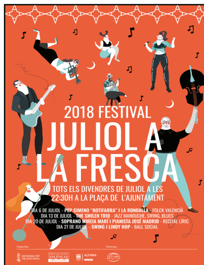
Recital de música americana en Alfara del Patriarca 2018.