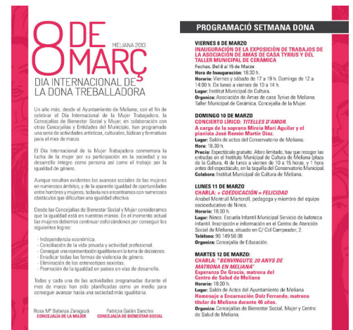
Recital líric en el Auditorio de Meliana. Marzo 2013.