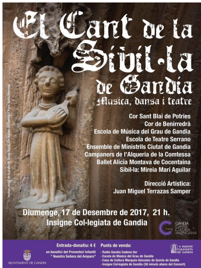
Concierto "El cant de la Sibil·la" en la Colegiata de Gandia. Diciembre 2017.