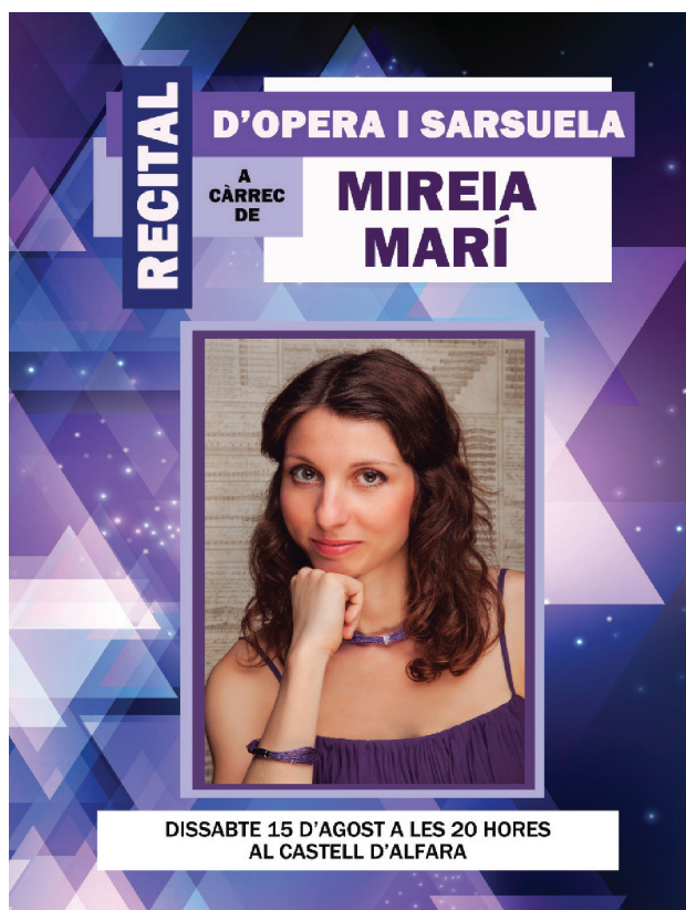
Recital lírico en el Palau de la Senyoria de Alfara del Patriarca. Agosto 2016.