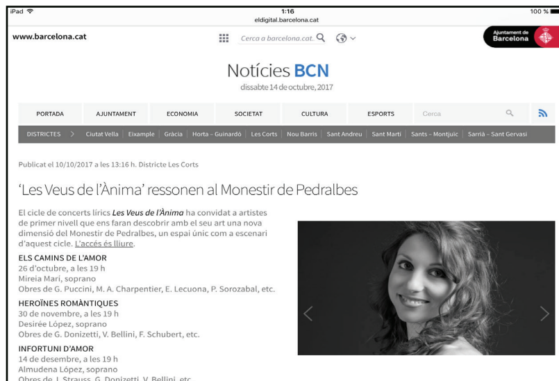
Recital líric en el Monestir de Pedralbes. Octubre 2017.