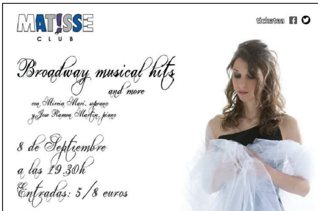
Recital en la Sala Matisse Valencia. 2018.