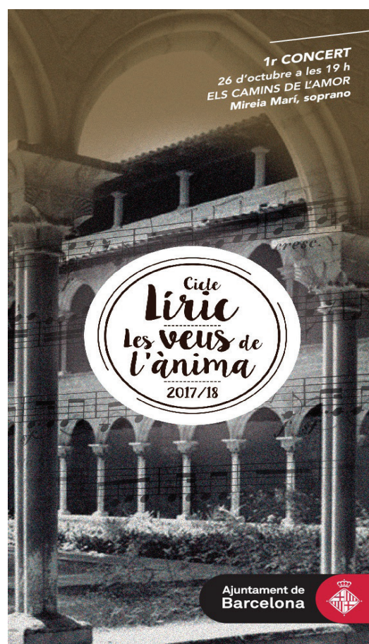
Recital lírico en el Monestir de Pedralbes. Octubre 2017.