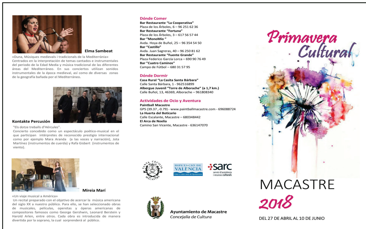
Recital en la Casa de Cultura de Macastre 2018.