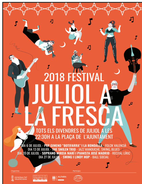
Recital de música americana en Alfara del Patriarca 2018.