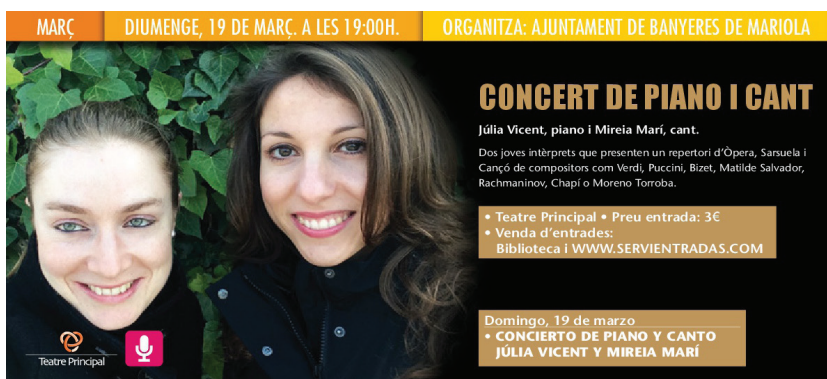
Recital líric en el Auditorio de Banyeres de Mariola. Mayo 2017.