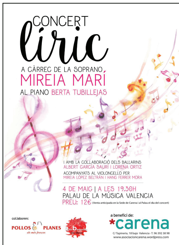
Recital líric en el Palau de la Música. Mayo 2017.