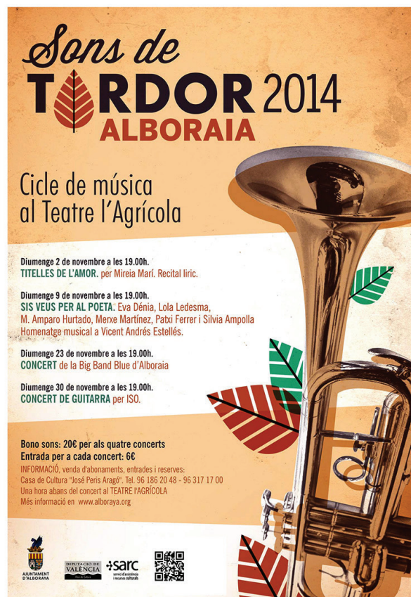
Recital lírico en el Teatro l'Agrícola de Alboraia. Noviembre 2014.