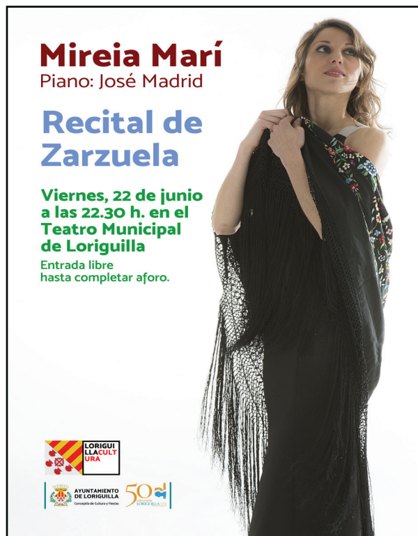
Recital de Zarzuela en el Teatro Municipal de Loriguilla 2018.