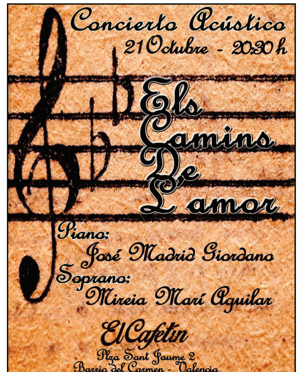
Recital líric en la plaza Sant Jaume de Valencia. Octubre 2017