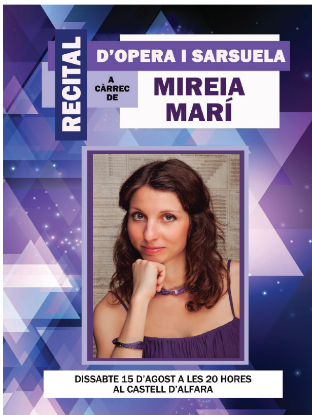
Recital lírico al Palau de la Senyoria de Alfara del Patriarca. Agosto 2016.