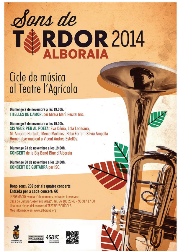
Recital lírico en el Teatro l'Agrícola de Alboraia. Noviembre 2014.