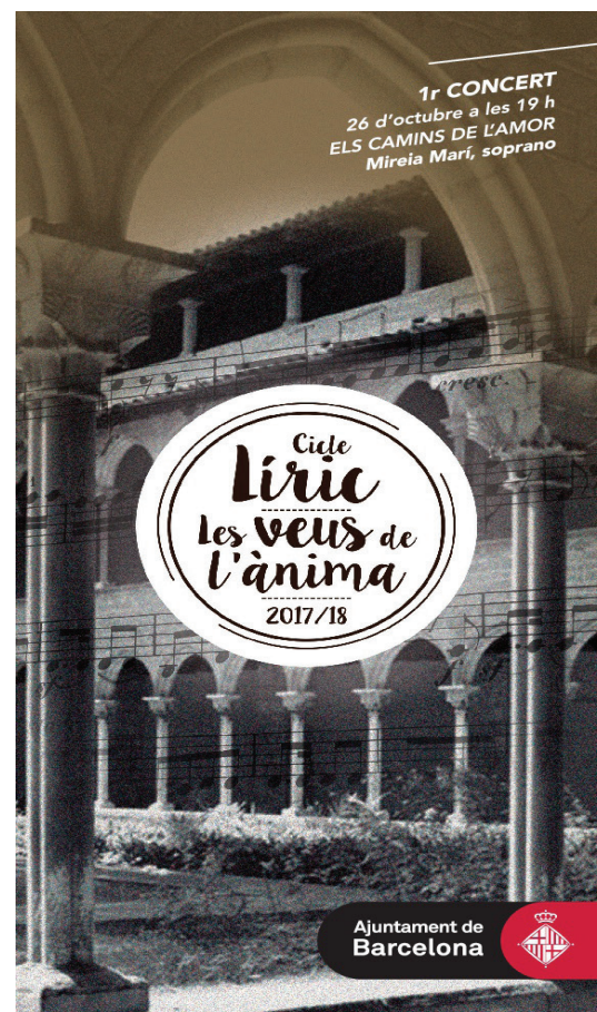
Recital lírico al Monestir de Pedralbes. Octubre 2017.