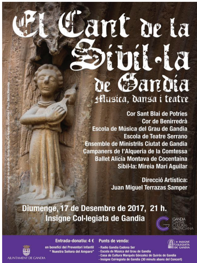
Concierto "El cant de la Sibila" en la Colegiata de Gandia. Diciembre 2017.